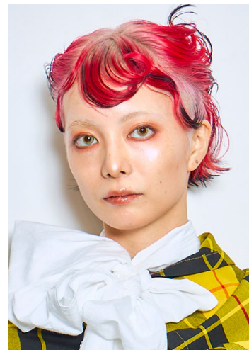
Risa TICK-TOCK 兵庫県