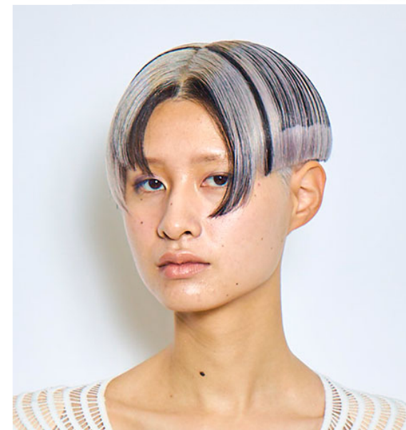
別所 義之 アシスタント 東 紘音 SCREEN 兵庫県