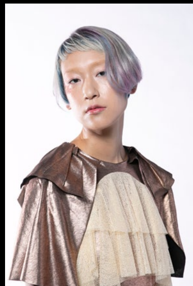
YSO 電髪倶楽部 street 埼玉県