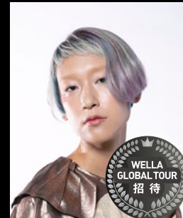
YSO 電髪倶楽部street / 埼玉県