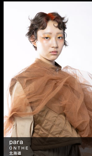
para ON THE 北海道