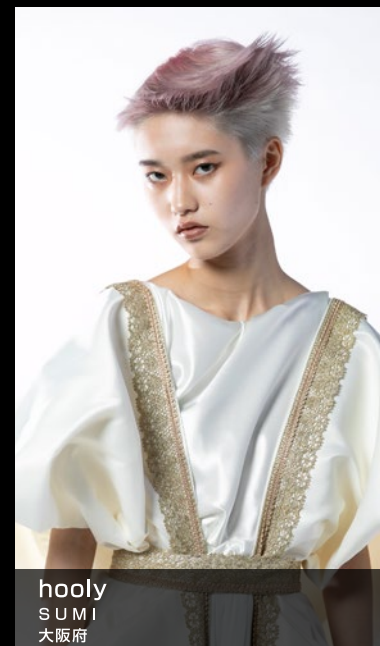
hooly SUMI 大阪府