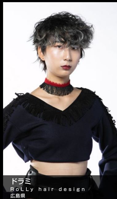
ドラミ RoLLy hair design 広島県