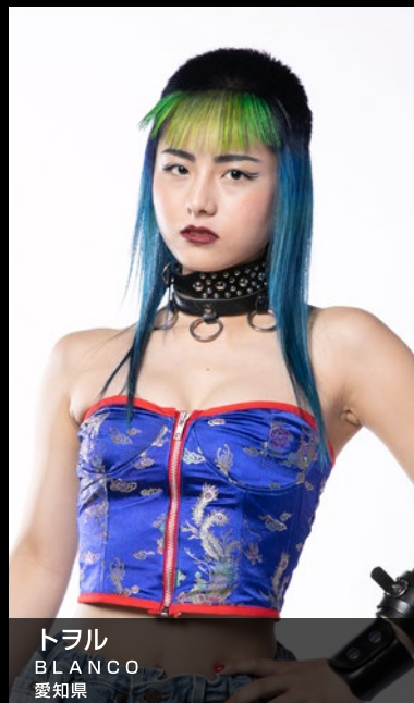
トヲル BLANCO 愛知県